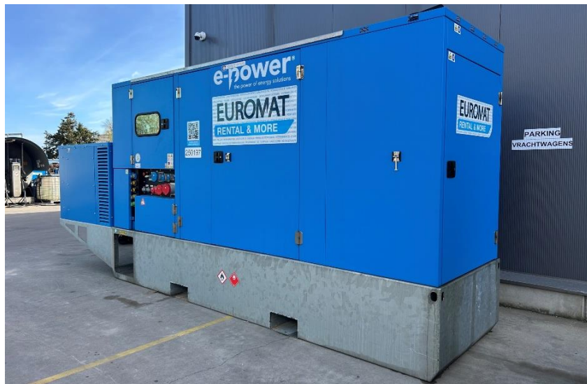
Fiche tweedehands machines